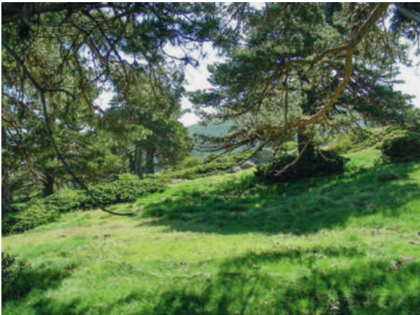
Abb. 3. Sierra de Baza, Andalusien: Potenzielles Habitat des Zitronenzeisigs in einem lockeren Bestand von Waldhöhen Pinus sylvestris bei Prados del Rey auf 1880 m ü.M. Aufnahme vom 29. Mai 2009, Hans Märki.

Little valley with a brook close to the breeding site of Puerto de la Ragua, Sierra Nevada, 27 May 2009.