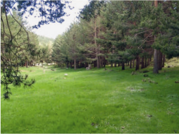
Abb. 2. Sierra Nevada, Andalusien: Tälchen mit einem kleinen Bach und aufgeforsteten Waldhöhen Pinus sylvestris südlich des PASSES Puerto de la Ragua (an der Provinzgrenze Almería–Granada) auf 2038 m ü.M. Die Bruthabitate liegen nordwestlich der Puerto de la Ragua. Aufnahme vom 27. Mai 2009.

Little valley with a brook close to the breeding site of Puerto de la Ragua, Sierra Nevada, 27 May 2009.