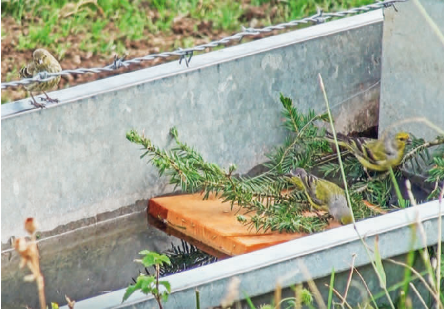
Abb. 6. Zitronenzeisige beim Trinken auf schwimmendem Brettchen und Tannenzweig im Brunnentrog auf dem Chasseral, Berner Jura. Aufnahme vom 28. August 2016, Hans Märki. Citril Finches drinking on a floating wooden board and pine branch in the well trough.

erscheinenden Rüttelflug starteten. Der Wasseraustritt war so gering und durch die Vegetation verdeckt, dass ich erst durch das Verhalten der Vögel auf diesen aufmerksam wurde. Ein Jahr später war diese undichte Stelle repariert, dafür tropfte es an anderer Stelle mit noch längerem Intervall bis zur Tropfenbildung. Auch diese, wieder durch die hohe Krautvegetation verborgene Stelle hatten die Zitronenzeisige entdeckt – möglicherweise auf der Suche nach der Stelle, an der im Vorjahr Wasser austrat.