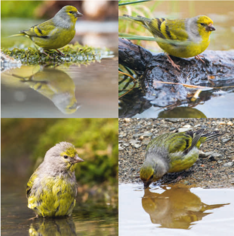
Abb. 1. Zitronenzeisigmännchen an Wasserstellen. Citril Finch males at water sources.

an ausgewählten Beispielen Habitate mit verschiedenem Wasserangebot und andererseits eine Reihe spezifischer Verhaltensweisen beim Trinken bei limitierter Wasserverfügbarkeit vorgestellt werden. Anschliessend werden Trinkbedürfnis und physiologische Aspekte näher betrachtet und ein Ausblick auf Auswirkungen von sich abzeichnenden Habitatveränderungen gegeben.