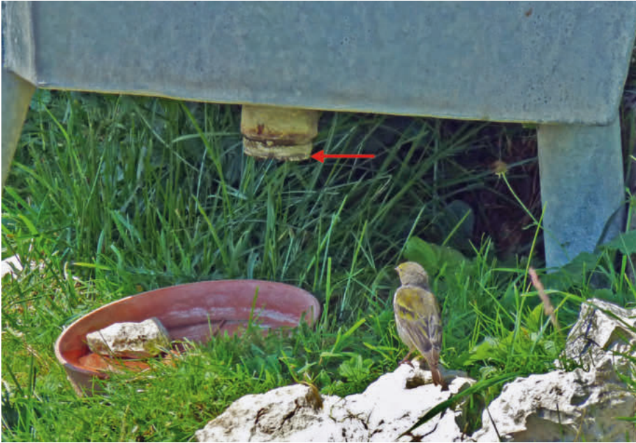
Abb. 5. Zitronenzeisig beim Brunnentrog mit verschlossenem, aber doch tropfendem Ausgussrohr (Pfeil) und flaches Gefäß mit Wasser auf dem Chasseral, Berner Jura. Aufnahme vom 28. August 2016, Hans Märki. Citril Finch at the well trough with a plugged but dripping spout (arrow). Flat vessel with water.

Wasserstandregler eingebaut wurde und so der Wasserstand etwa 15–20 cm unter dem Brunnenrand zu liegen kam. So erreichten die Zitronenzeisige das Wasser vom Rand des Brunnentrogs aus nicht mehr und waren gezwungen, andere Wasservorkommen zu nutzen. Die Brunnen bei den Sennereien werden auch erst beim Alpauftrieb des Viehs installiert, meist in der ersten Junidekade.