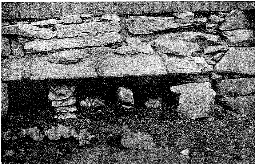
Brütende Eiderenten-Weibchen auf Roest.

Der ganze Archipel von Roest besteht aus 1020 grösseren und kleineren, teils bergigen, teils ebenen, teils bewohnten, teils unbewohnten Inseln, auf welchen 300—400 hölzerne, einstöckige, höchstens zweistöckige, mit Schindeln bedeckte Häuschen 800 Bewohnern Schutz gewähren. Die maximale Kälte ist -3^{\circ} C., die maximale Wärme 22^{\circ} C. Schnee fällt selten und bleibt nie liegen. Gewitter sollen kaum einmal vorkommen. Die Luftfeuchtigkeit aber ist sehr gross, alle Dinge werden rasch grau. Fischfang ist die Hauptbeschäftigung der genügsamen Bevölkerung; daneben besitzen die Leute ein wenig Land, ein mageres Gärtchen mit Kopfsalat, gelben Rüben und Rhabarber. Zwei oder drei Kühe vervollständigen ihre Habe. Rührend ist die Liebe der Bewohner zu ihren Zimmerpflanzen. Strassen gibt es beinahe keine auf Roest, in diesem kleinen Venedig des Nordens fährt man im Ruder- oder Motorboot von einem Pfahlbau zum andern. Kein Baum, kein Strauch unterbricht die reine Horizontlinie. Der steinreiche Boden ist mit karg-