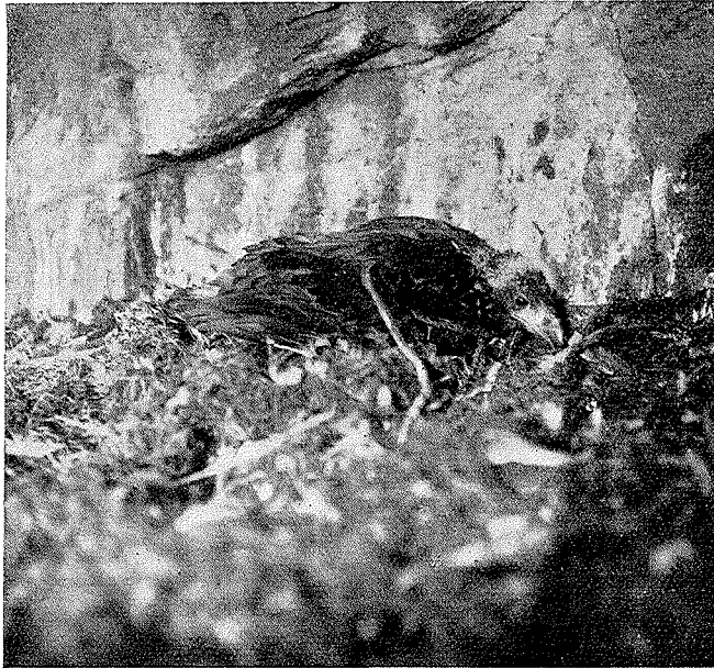
Junger Seeadler auf Stavoen.

Besondere Erwähnung verdienen die Vogelberge der nordnorwegischen Küste. Graswiesen haben die vollständige Herrschaft über Steilabstürze und Hochebenen übernommen, wahrscheinlich wegen der starken Düngung durch Vögel und Schafe. Vögel wirken durch Samenverschleppung, Düngung des Bodens als richtige Pflanzenverbreiter, aber auch durch Vertilgung von Schädlingen im Sinne des Pflanzenschutzes. Zwischen Vogel- und Pflanzenwelt bestehen aus diesem Grunde mannigfache Wechselbeziehungen. Unzählige Pflanzen liefern wiederum den Vögeln Nahrung in der verschiedensten Form,