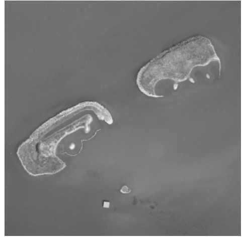
Abb. 4. Die Fanelinseln heute.

Eingaben. Die Ala-Reservatskommission stellte mit Hilfe von Andreas Bossert wichtige Grundlagen aus der vorangehenden Sanierung der Fanel-Inseln in den 1980er-Jahren zusammen. Ala und BirdLife Schweiz werden neben anderen Institutionen in einer Arbeitsgruppe der AGC mitarbeiten.