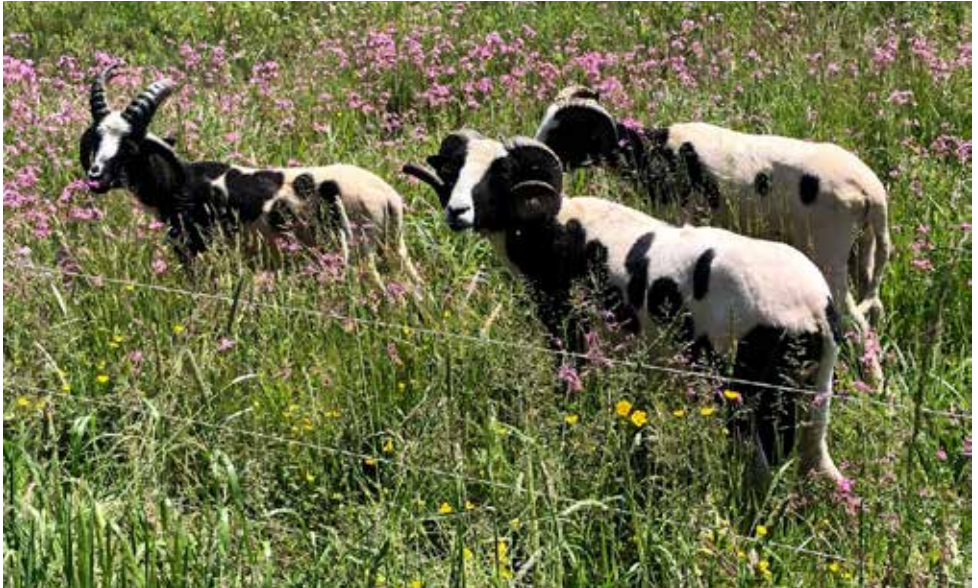
Abb. 7. Jakobsschafe im Ala-Reservat Wengimoos.