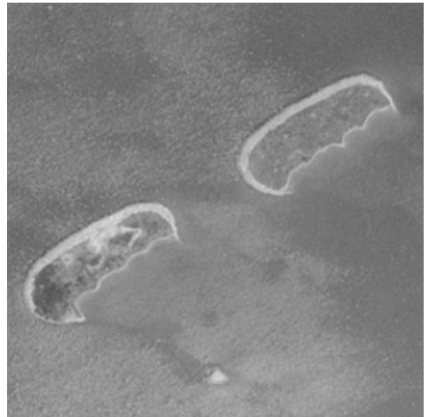
Abb. 2. Die Fanelinseln (rechts Berner Insel) vor der ersten Sanierung in den 1980er-Jahren.

Seeregulierungen: Die Reservatskommission nahm sich erneut der Frage der Seeregulierungen an. Die grossen Seen, an denen wichtige Feuchtgebiete liegen, werden im Frühling vorsorglich abgesenkt, damit bei grossen Niederschlägen und der Schneeschmelze keine Überschwemmungen auftreten. Für die Feuchtgebiete, die als national bedeutende Moore geschützt sind, kann