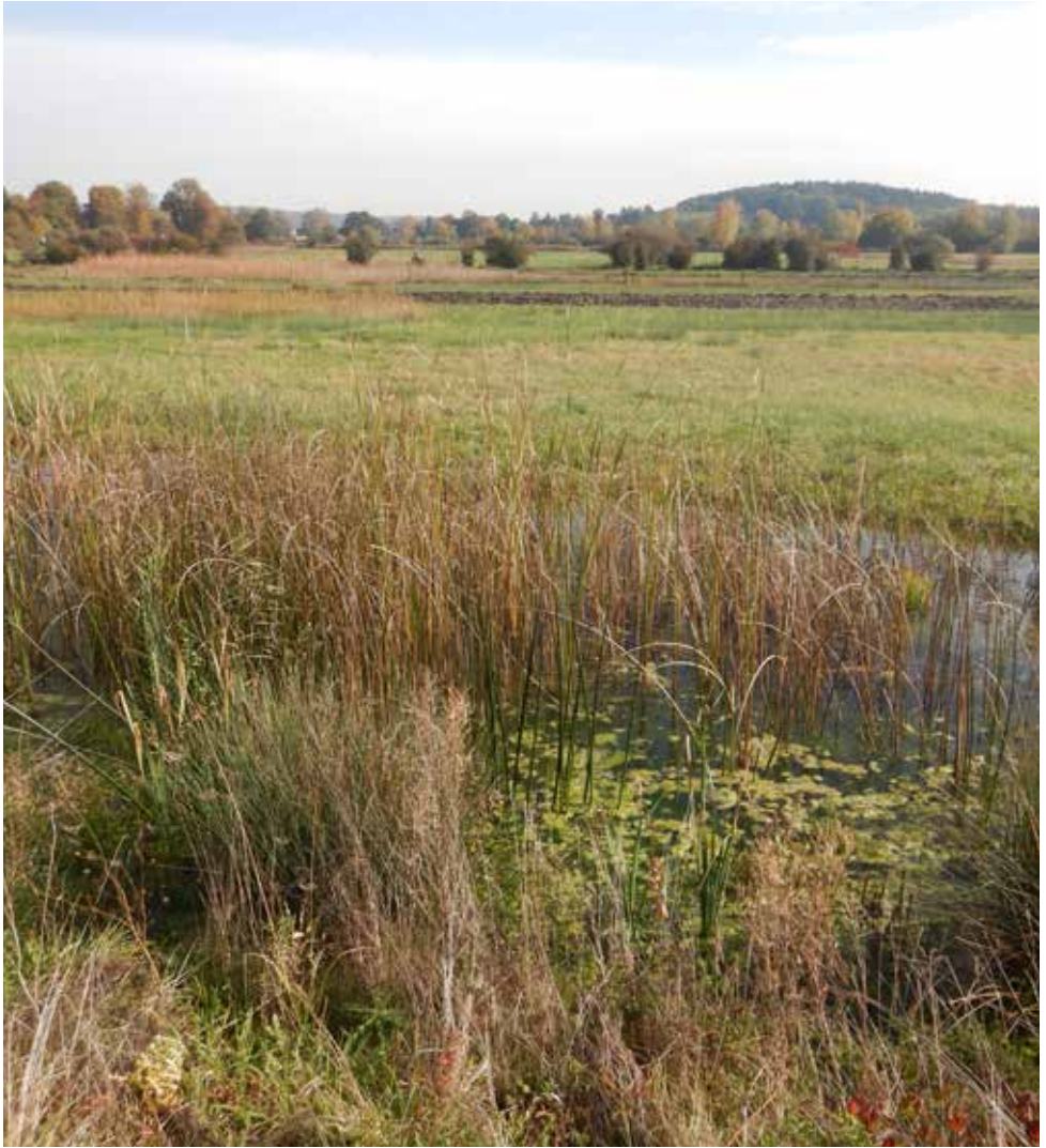
Abb. 1. Neeracherried: die vor zwanzig Jahren renaturierten Dorfweiden

Ala, Schweizerische Gesellschaft für Vogelkunde und Vogelschutz