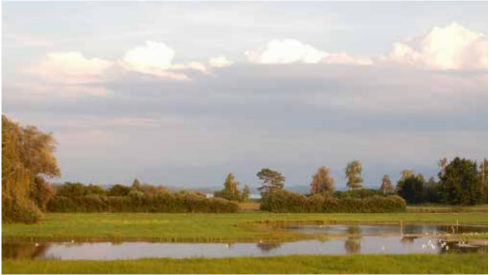
Abb. 11. Unterer Greifensee. Das grosse Riedgebiet zwischen dem Glattausfluss und der Gemeinde Greifensee.

hat mit einem Projekt spezifische Massnahmen für die Kammmolche geschaffen, welche auch allen anderen Amphibien und Reptilien dienen. Im Häxenwald wurden 2 Teiche erweitert, welche jeweils früh im Jahr von Grasfröschen besucht werden. Dank der Auslichtung hat es mehr Sonnenlicht, welches für die Entwicklung der Larven wichtig ist.