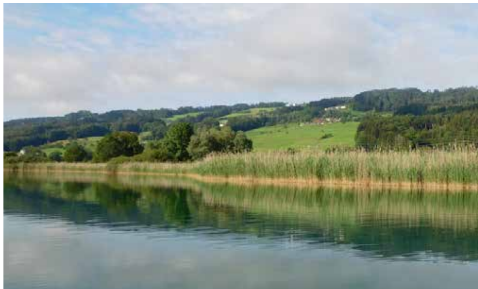
Abb. 9. Schilfsaum am Baldeggersee.

Fitis 2-3, Klappergrasmücke 0, Nachtigall 0-1, Rohrammer 7.