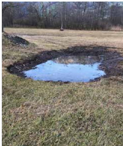
Abb. 10. Ala-Reservat Lauerzersee: einer der vielen neuen Teich.

Von Seiten des Kantons gibt es verschiedene Projekte in grösserem Rahmen. Das eine Projekt ist die Schüttung im Südteil mit Mate-