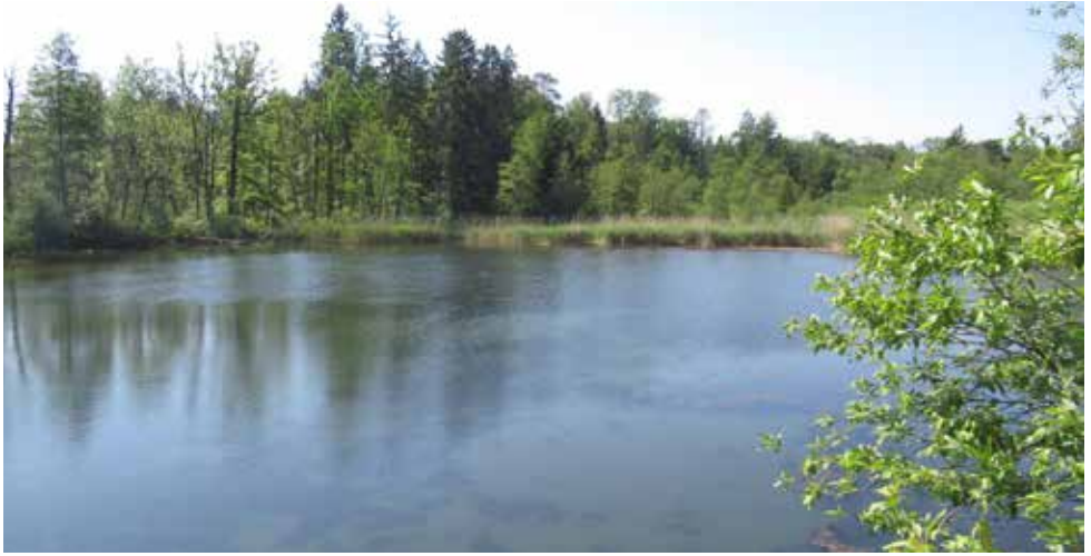
Abb. 8. Ala-Reservat Gerlafinger Weiher.

Hektaren Ried gemäht. Neben den kantonalen Stellen waren auch die Betreuer und vier Schulklassen aus Bern im Einsatz. Das starke Aufkommen von Birken auf den abgeschürften Flächen erforderte Spezialeinsätze der ANF. Mit der Stockfräse wurde ein dritter Abschnitt bearbeitet und anschliessend gemulcht.