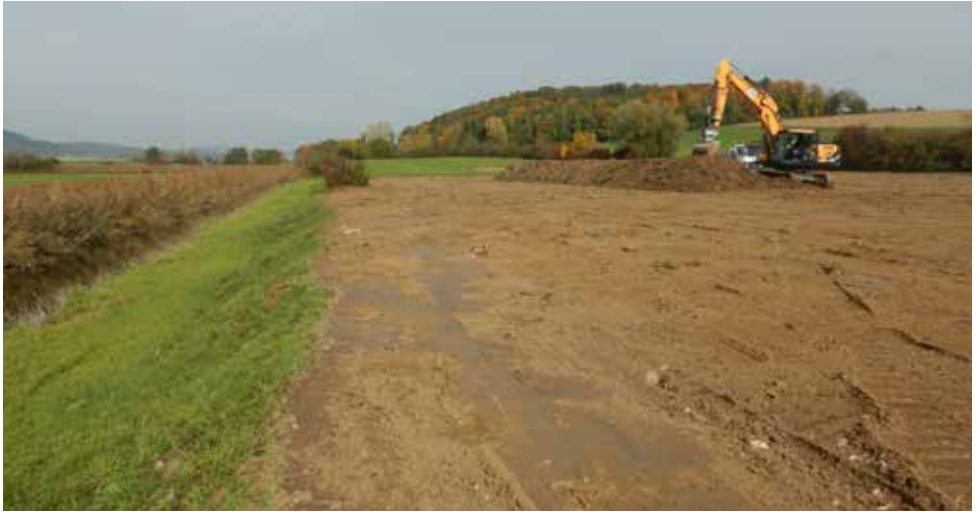
Abb. 12. Neeracherried: Die letzte Phase der Renaturierung der Saumbachwiesen startete im Herbst 2020.

zentrum. Der Wasserstand war im Frühling hoch, senkte sich aber in der zweiten Hälfte der Brutsaison deutlich. Seit längerem diskutieren Ala, BirdLife Schweiz und FNS über ein neues Wehr.