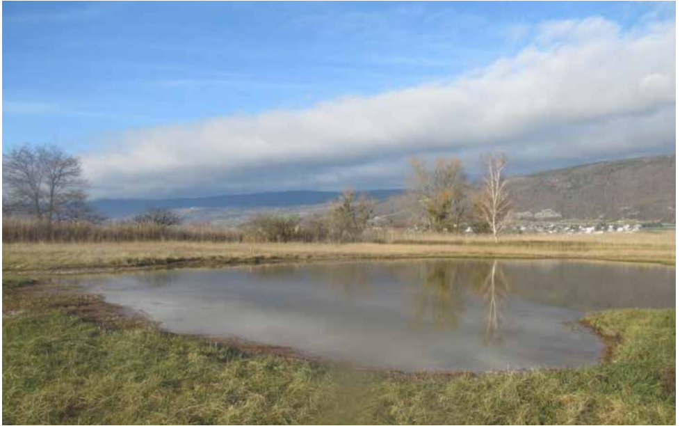
Abb. 6. Heideweg. Im nordöstlichen Teil erstellte der Kanton Bern im Winterhalbjahr 2019-2020 einen Flachteich.