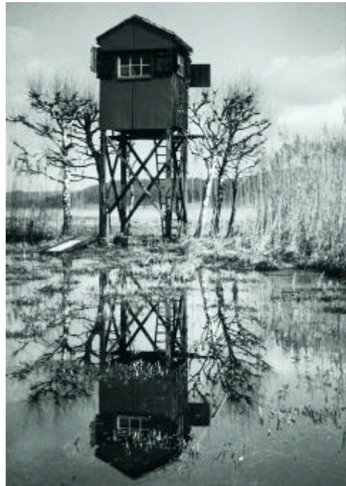
Abb. 2. Der Schinz-Turm im Neeracherried (hier im Zustand von 1927) wurde renoviert, wird aber nicht mehr benützt.

Das neue Schutzgebietskonzept, das die Orniplan AG im Auftrag der Ala und des SVS verfasste, ging in die Vernehmlassung. Die Fachstelle Naturschutz gab ein neues Weidekonzept in Auftrag. Es soll die Beweidung mit Schottischen Hochlandrindern durch den SVS neu regeln. Die im Vorjahr renaturierten Dorfswis haben sich gut entwickelt. Der der Ala