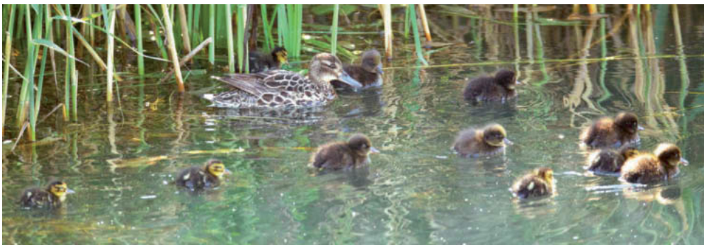
Abb. 2. Knäkenten-♀ Anas querquedula mit 5 eigenen und 6 Reiherentenpull. Aythya fuligula . Kaltbrunner Riet SG, 28. Juni 2014. K. Robin. – Female Garganey Anas querquedula with five own chicks and six chicks of Tufted Duck Aythya fuligula . Kaltbrunner Riet (canton of St. Gallen), 28 June 2014.

An den langjährig besetzten Brutgewässern Wichelsee OW, Eglisauer Stau ZH und Zürich-Obersee wurden 6 Familien gefunden (Mittel 2009–2013: 8 Bruten an 5 Orten).