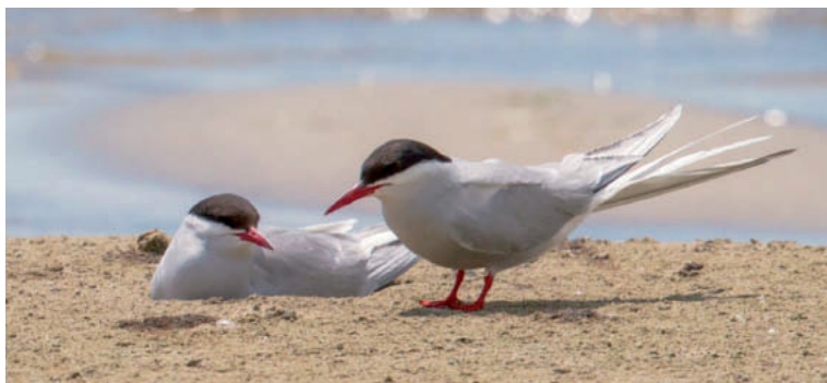
Abb. 4. Das Paar der Küstenseeschwalbe Sterna paradisaea am Nest auf der Sandbank, der eine ad. am Bebrüten des ersten Geleges (oben). Ein ad. bei der Nistmulde mit 2 Eiern (unten). Chablais de Cudrefin VD, 15. Juni 2014. T. Nierle. – The pair of Arctic Tern Sterna paradisaea on the nest on the sandbank, one of the adults incubating the first clutch (above). One of the adults on the nest depression with two eggs (below). Chablais de Cudrefin (Vaud), 15 June 2014.

Der Brutbestand war mit 583 BP in 17 Kolonien im Bereich der Vorjahre (Mittel 2009–2013: 623 BP in 18 Kolonien). Die Orte und Grössen der Kolonien blieben über die Jahre ziemlich konstant. Bei folgenden Kolonien gab es Änderungen: Auf dem Floss von Pointe-à-la-Bise GE am unteren Genfersee gab es keine Bruten, da dieses durch ein Paar Mittelmeer-möwen besetzt war (D. Landenbergue, H. Candolfi). Erstmals seit 2005 gab es wieder eine Brut auf dem Floss Chlisee am Südufer des