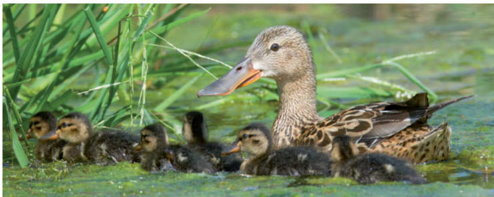
Abb. 1. Löffelenten-♀ Anas clypeata mit 6 pull. Kaltbrunner Riet SG, 16. Juni 2014. K. Robin. – Female Northern Shoveler Anas clypeata with six chicks. Kaltbrunner Riet (canton of St. Gallen), 16 June 2014.

6 Brutnachweise an 3 Orten (Mittel 2009–2013: 7 Bruten an 3 Orten): 1 Fam. mit 2 pull. am Südufer des Neuenburgersees (AGC, P. Rapin), 4 Fam. mit insgesamt 21 pull. am Klingnauer Stausee AG (E. Weiss u.a.) und 1 Fam.