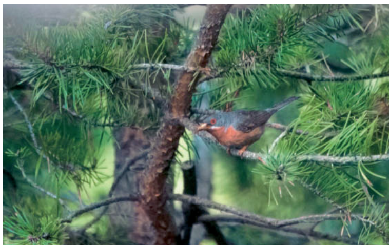
Abb. 5. Weissbartgrasmücken-♂ Sylvia cantillans mit Futter für die Flügglinge. Mittelwallis, 4. August 2014. – Male Subalpine Warbler Sylvia cantillans with food for the fledglings. Central Valais, 4 August 2014.

eine Brutzeitbeobachtung im Churer Rheintal (U. Bühler, S. Werner) sowie ein Revier und eine Brutzeitfeststellung im Prättigau (U. Bühler). Auf eine Ausdehnung des Areals oder bisher unentdeckte Vorkommen weisen ein trommelndes ♂ während der Brutzeit im Kanton Schwyz (T. Bonnet in Marques & Thoma 2015) sowie zwei Beobachtungen knapp ausserhalb der Brutzeit im Oberhalbstein GR und im Sarganserland SG hin (P. & B. Giacometti, A. Good in Marques & Thoma 2015).