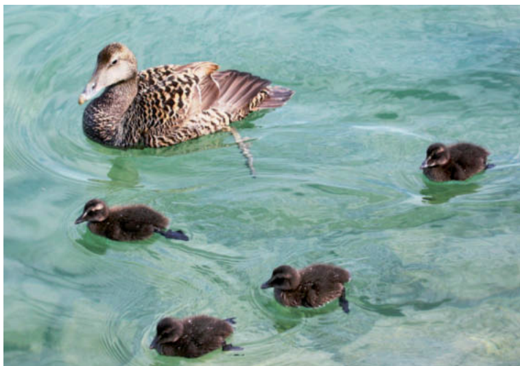
Abb. 3. Eiderenten-♀ Somateria mollissima mit 4 pull., eine der 4 Familien am Zürich-Obersee. Freienbach SZ, 3. Juni 2014. K. Anderegg. – Female Common Eider Somateria mollissima with four chicks, one of the four families on upper Lake Zurich. Freienbach (canton of Schwyz), 3 June 2014.