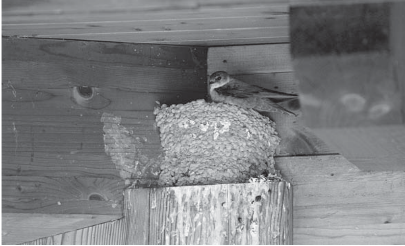
Abb. 1. Felsenschwalbe auf ihrem Nest am Mehrzweckgebäude in Gluringen. Aufnahme vom 9. Juni 2006, P. Hauff. – Nest of Crag Martin under the roof of the local-government board of Gluringen (9 June 2006).

Nestlingsfutter in unmittelbarer Nähe gesammelt werden kann. Die Nester von Nestjunge fütternden Felsenschwalben sind – von Ausnahmen abgesehen – denn auch relativ leicht zu finden, weil sich die Altvögel in dieser Zeit selten weit davon entfernen. Sie befinden sich in aller Regel unter dem Dachvorsprung, entweder an den Putz der Mauer, an die Holzwand oder an Dachsparren geklebt oder auf Firstbalken angelegt (Abb. 1).