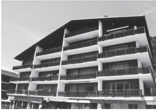
Abb. 5. Appartementhaus mit Postbüro von St-Luc, ein eher untypischer Brutort der Felsenschwalbe. Das Nest befindet sich trotz der vielen Balkone auf dem Firstbalken der Südfassade. Solche Gebäude wurden bisher weitgehend gemieden, oder es wurde eine balkonfreie Fassade als Neststandort gewählt. Aufnahme vom 8. Juli 2008, U. Glutz von Blotzheim. – A rather unusual breeding site under the ridge of a large apartment-house in St-Luc. Façades with balconies up to the highest apartment are normally avoided by Crag Martins. If they choose such buildings, they prefer façades without balconies as nest site (8 July 2008).

unmittelbarer Nähe der Gebäude zuzusehen (Abb. 3). Statt sich über die Ansiedlung dieser in Siedlungen immer noch seltenen Gäste zu freuen, nimmt die Zahl der Hauseigentümer, die sich über Scheinangriffe oder Kots Spuren unter den Nestern ärgern, sprunghaft zu. Nester werden heruntergerissen und bereits benutzte Niststellen mit Karton, Kunststoffen, Holzbrettern oder Drahtgeflecht unzugänglich gemacht, und dies neuerdings auch an Standorten, wo die Schwalben jahrelang geduldet (oder nicht beachtet) worden sind. Dabei wäre es in den meisten Fällen so einfach, etwa 1,5 m unter dem Nest ein den Kot auffangendes Brettchen anzubringen. Dafür gibt es viele gute, z.T. sogar überaus ästhetisch wirkende Beispiele!