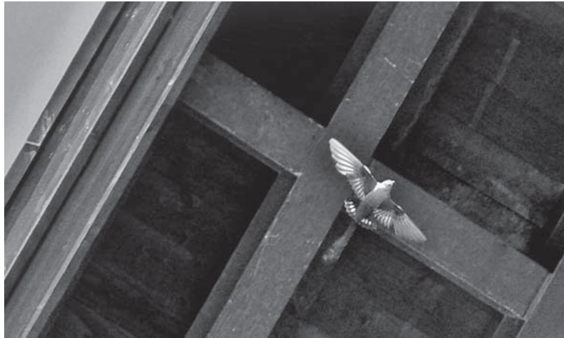
Abb. 3. Felsenschwalbe im Flug vor der Dachuntersicht des Hotels Garni Imseng in Saas-Fee. Aufnahme vom 13. Juli 2007, P. Hauff. – Crag Martin in flight near its nest, built on top of a spot-light, on the sunlit wall of a hotel in Saas-Fee (13 July 2007).

sind bis jetzt sehr selten. Am eindrucklichsten ist ein 2008 neu angelegtes Nest auf dem nur wenige Meter über dem obersten Balkon liegenden Firstbalken der Südfassade des Appartementhauses, in dem das Postbüro von St-Luc untergebracht ist (Abb. 5).