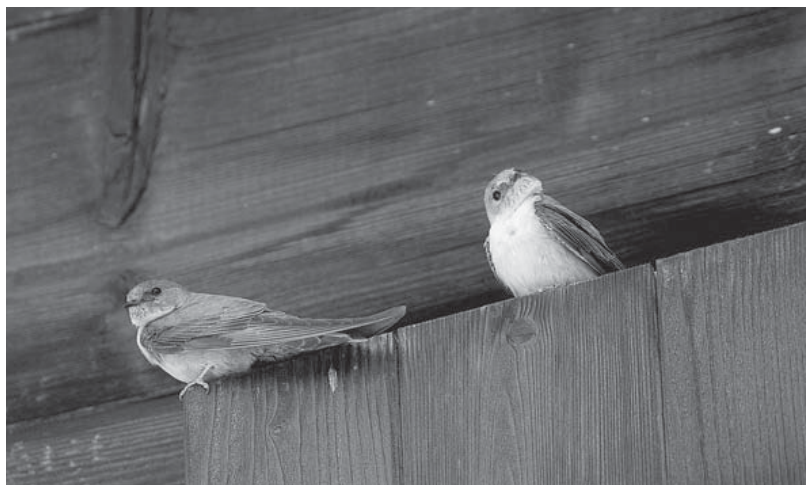
Abb. 4. Auf einem Gebäudesims ruhende Felsenschwalben in Unterwassern bei Oberwald. Aufnahme vom 8. Juni 2006, P. Hauff. – Crag Martin pair resting on the ledge of wooden boards under their nest (8 June 2006).

März heim. Einzelne Paare beginnen bereits im April Nester auszubessern oder zu bauen (1./2.4.2004 Zermatt; J. Savioz), die eigentlichen Nistplätze werden aber meist erst im Mai besetzt. Keine andere Schwalbenart hat ein so reichhaltiges, wenn auch mit Ausnahme des Warnrufs «dzrji» unauffälliges Lautrepertoire. Am frühen Morgen sonnt sich das Paar, später die ganze Familie auf Balkenköpfen, Fenstersimsen oder Fenstereinrahmungen einer früh besonnten Fassade; später lohnt es sich, den nimmermüden wendigen Flugkünstlern in