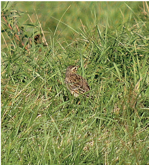
Abb. 8. Spornpieper Anthus richardi 1.KJ; dieses Individuum ist noch praktisch vollständig im Jugendkleid. Thuner Allmend BE, 7. Oktober 2006. H. U. Grütter. – Richard's Pipit Anthus richardi 1 st cy ; this individual is still almost completely in juvenile plumage. Thuner Allmend (canton of Berne), 7 October 2006.

April oder Anfang Mai nachgewiesen. Die meisten Feststellungen betreffen ♂; neben dem Brutpaar konnten erst zwei ♀ beobachtet werden.