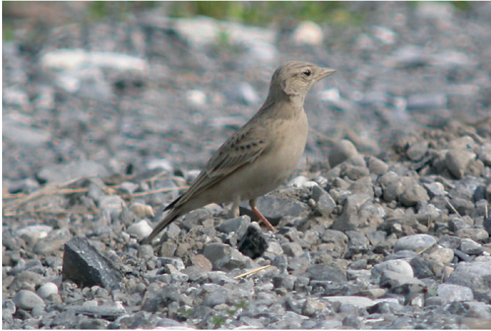
Abb. 7. Kurzzechenlerche Calandrella brachydactyla . Thuner Allmend BE, 16. September 2006. S. Stutz. – Greater Short-toed Lark Calandrella brachydactyla . Thuner Allmend (canton of Berne), 16 September 2006.

April oder Anfang Mai nachgewiesen. Die meisten Feststellungen betreffen ♂; neben dem Brutpaar konnten erst zwei ♀ beobachtet werden.