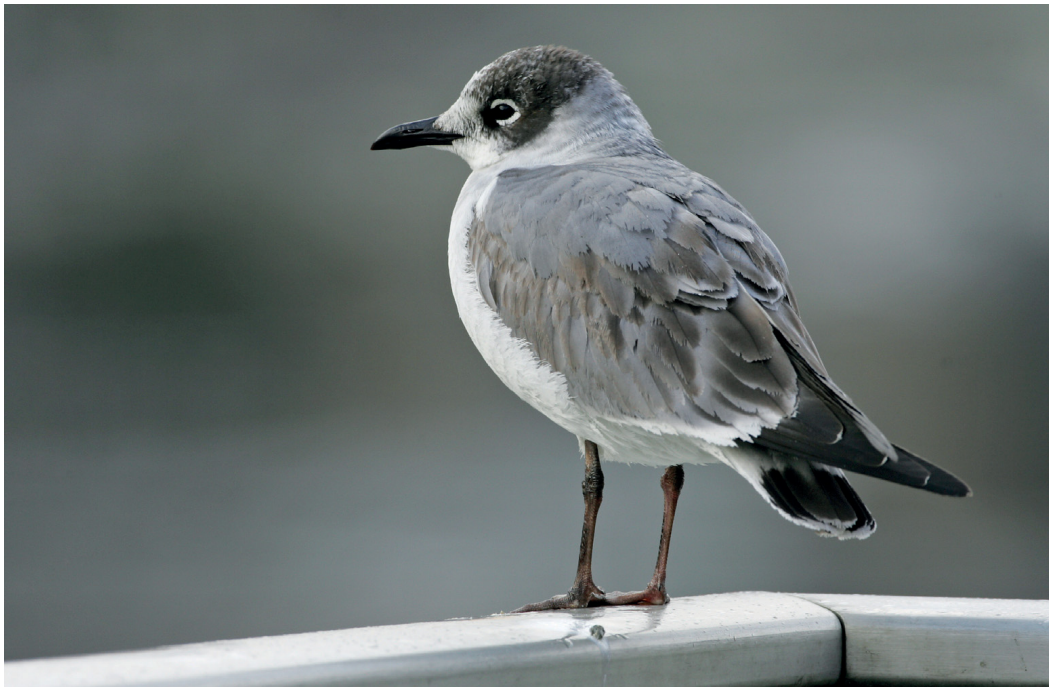
Abb. 5. Präriemöwe Larus pipixcan 2.KJ. Schaffhausen, 22. Januar 2006. G. Schuler. – Franklin's Gull Larus pipixcan 2 nd cy. Schaffhausen, 22 January 2006.

VD – Genfersee zwischen Allaman und Thonon F, 19. August, ad., Foto (E. Bernardi, C. Widmann, O. Jean-Petit-Matile).