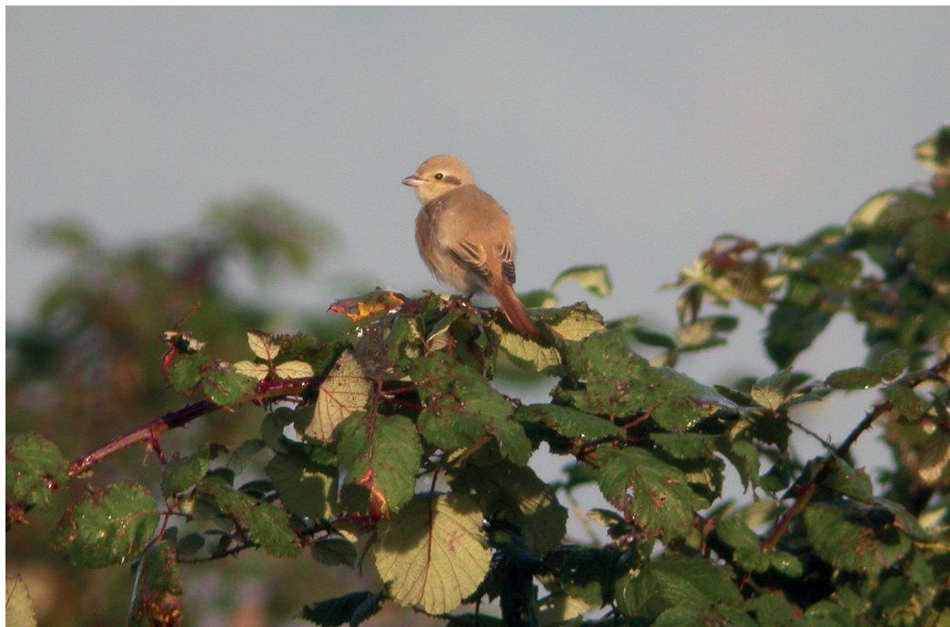
Abb. 11. Isabellwürger Lanius isabellinus 1.KJ. Laconnex GE, 8. Oktober 2006. D. Saluz. – Isabelline Shrike Lanius isabellinus 1 st cy. Laconnex (canton of Geneva), 8 October 2006.

Der Heilige Ibis brütet in Afrika südlich der Sahara (früher auch in Ägypten), auf Madagaskar und Aldabra sowie in einer kleinen Population im südöstlichen Irak (del Hoyo et al. 1992). Seit den Siebzigerjahren sind immer wieder Heilige Ibisse aus frei fliegenden Zoopopulationen entkommen, und mittlerweile haben solche Gefangenschaftsflüchtlinge in Spanien, Frankreich, Italien und auf den Kanarischen Inseln gebrütet (Yésou & Clergeau 2005). In Italien brüteten 2000 26 Paare in der Poebene, 2003 in einer zweiten Kolonie 25–30 Paare und einige weitere Paare 2004 in einer dritten Kolonie (Yésou & Clergeau 2005). An der französischen Atlantikküste nistet der Heilige Ibis in mehreren Kolonien, und die Population wurde 2005 auf etwas mehr als 1100 Brutpaare geschätzt. Alle Vögel stammen von der frei