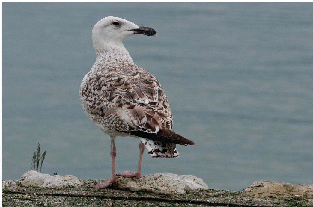
Abb. 6. Mantelmöwe Larus marinus 2.KJ. Portalban FR, 18. Mai 2006. – Great Black-backed Gull Larus marinus 2 nd cy. Portalban (canton of Fribourg), 18 May 2006.

VD/FR/BE/NE – Nachtrag : Chevroux, 26.–28. Oktober, 12. Dezember 2005 und 2. Januar, 27. Oktober, 27. November 2006, 1.KJ bzw. 2.KJ, Foto (S. Aubry, Y. Rime, P. Rapin); Portalban, 4. Januar 2006 – 3. April 2007 und 13.–17. April, 21./26. Mai – 18. Juni, 12.–24. Juli, 3. August und 3. September 2007, 2.KJ bzw. 3.KJ, Foto, Abb. 6 (S. Aubry, C. Sinz et al.); Fanel/Chablais de Cudrefin, 21. Januar, 14. Juli, 10. August, 14. Oktober und 1. November 2006, 2.KJ, Foto (M. Schweizer, P. Rapin, M. Zimmerli, P. Mosimann-Kampe, K. Eigenheer), 28./30.–31. März, 7.–11./20. April, 23. Mai, 29. Juli, 4./14. August und 3.–4. September 2007, 3.KJ, Foto (J. Mazenauer et al.); Ins, 30. März und 4. Oktober 2006, 2.KJ (C. Sinz, P. Mosimann-Kampe); Chrümli, 2. April 2006, 2.KJ (C. Sinz); Missy, 18. April und 17. August 2006, 2.KJ (C. Sinz), 25. Februar, 19. März und