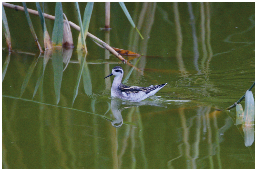
Abb. 4. Odinshühnchen Phalaropus lobatus 1.KJ. Aarberg BE, 8. August 2006. D. Saluz. – Red-necked Phalarope Phalaropus lobatus 1 st cy. Aarberg (canton of Berne), 8 August 2006.

Der sechste Nachweis seit 1900 und eine für den Schreiadler eher späte Beobachtung.