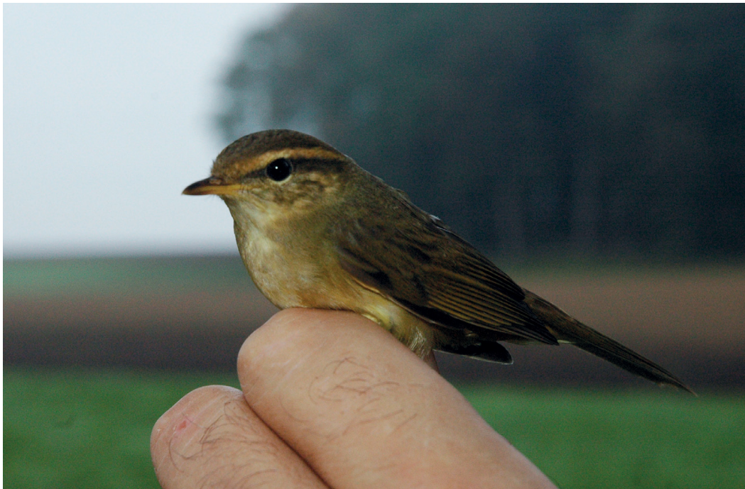
Abb. 10. Bartlaubsänger Phylloscopus schwarzi . Villaraboud FR, 14. Oktober 2006. C. Piller. – Radde's Warbler Phylloscopus schwarzi . Villaraboud (canton of Fribourg), 14 October 2006.

Die neueren Nachweise von 1997, 2003 und 2004 werden neu alle in Kategorie D (statt Kategorie A) gestellt, da nicht auszumachen ist, ob sie Wildvögel (Kategorie A), eingebürgerte Vögel (Kategorie C) oder Gefangenschaftsflüchtlinge (Kategorie E) betreffen. Auch zukünftige Nachweise werden in Kategorie D platziert, ausser die Vögel sind beringt und stammen aus dem ursprünglichem Brutgebiet (Kategorie A), aus den eingebürgerten Brutpopulationen in Belgien, den Niederlanden oder Deutschland (Kategorie C) bzw. sicher aus einer Voliere (Kategorie E).