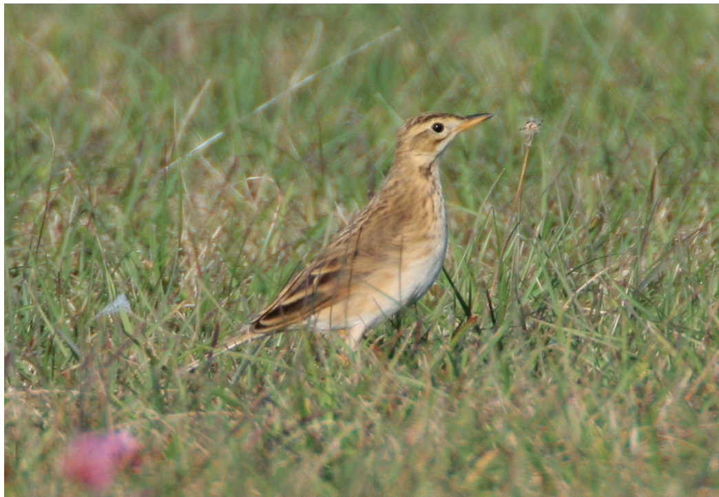
Abb. 9. Spornpieper Anthus richardi ; Altvogel oder Individuum mit abgeschlossener Postjuvenilmauser im ersten Winterkleid. Bière VD, 12. Oktober 2006. – Richard's Pipit Anthus richardi ; adult or individual with completed postjuvenile moult in first winter plumage. Bière (canton of Vaud), 12 October 2006.

Die zweite Feststellung des Seggenrohrsängers im Wallis seit 1992. Am Südostufer des Neuenburgersees, dem wichtigsten Rastplatz dieser Art in der Schweiz, gelangen im Berichtsjahr keine Nachweise.