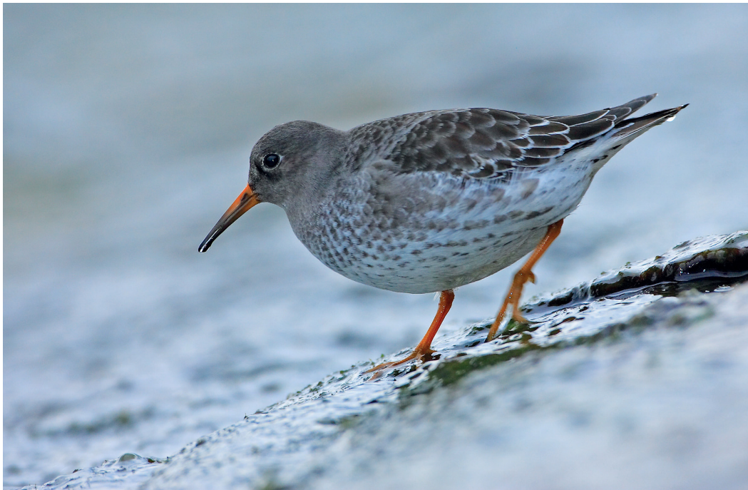
Abb. 3. Meerstrandläufer Calidris maritima 1.KJ. Genf, 25. November 2006. R. Burri. – Purple Sandpiper Calidris maritima 1 st cy. Geneva, 25 November 2006.