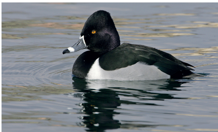
Abb. 1. Ringschnabelente Aythya collaris ♂ ad. Zürich, 13. März 2006. G. Schuler. – Ring-necked Duck Aythya collaris ♂ ad. Zurich, 13 March 2006.

ZH – Zürich, 12.–21. März, ♂ ad., Foto, Abb. 1 (S. Ruppen et al.).