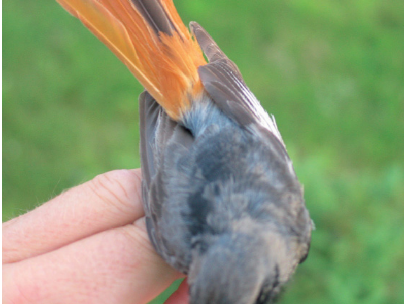
Abb. 3. Die Rückenzeichnung des bilateral gynandromorph gefärbten Hausrotschwanzes bestand aus einem fleckigen Mosaik von männlicher und weiblicher Ausprägung. Erkennbar ferner die links und rechts unterschiedliche Färbung des Flügelspiegels. Aufnahme vom 14. Juni 2003. – Dorsal view of a probable gynandromorph Black Redstart revealing a mosaic of female and male coloration. Lateral difference in wing patch coloration is also visible (14 June 2003).

handelt. Dieser hätte bei der Jugendmauser im Spätsommer des ersten Kalenderjahrs auf der ganzen linken Körperseite vorzeitig wesentliche Teile des Grossgefieders im Flügel vermausert und bereits Merkmale von mehrjährigen Adult-♂ linksseitig im Bauchbereich sowie mosaikartig auf dem Rücken ausgebildet. Eine akzelerierte Mauser im ersten Kalenderjahr ist von den inneren Armschwingen (Schirmfedern) bekannt (Nicolai 1992). Nicolai (1992) beschreibt fünf Sonderfälle von einspiegeligen Jährlingen aus einer Stichprobe von rund 500 Jährlingen. Diese Asymmetrien beschränkten sich aber offenbar immer auf den Flügelspiegel, und eine mögliche Verwechslung der einspiegeligen Jährlinge mit Gynandern diskutiert Nicolai (1992) nicht. Die zweite und dritte Erklärungsmöglichkeit stünde im Einklang mit meiner Altersbestimmung als Adultvogel von mindestens 1,5 Jahren: Bei der zweiten Variante hätte der Vogel bei der ersten Vollmauser im Herbst des zweiten Lebensjahrs nur linksseitig das Gefieder vermausert, wodurch rechtsseitig noch das «alte» Jährlingskleid fortbestanden hätte. Gegen diese Erklärung spricht die links- und rechtsseitig analoge Abnutzung des Gefieders. Dritte Variante: Der beobachtete Vo-