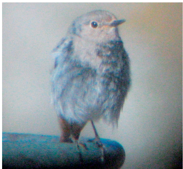
Abb. 1. Verschiedene Ansichten desselben, wahrscheinlich bilateral gynandromorphen Hausrotschwanzes in Jeizinen VS (Aufnahmen vom 7. April 2003). (a) Die Gefiederfärbung auf der linken Körperseite entspricht einem adulten ♂ (>1,5-jährig) unter anderem mit dem deutlich weissen Flügelspiegel. (b) Das Gefieder auf der rechten Körperseite trägt Merkmale eines ♀ bzw. eines vorjährigen ♂ des braunen Gefiedertyps ohne weissen Flügelspiegel. (c) Die ventrale Ansicht zeigt eine Trennlinie zwischen rechter, hauptsächlich weiblich-braun, und linker, männlich-schwarz gefärbter Bauchseite. – Pictures of a probable bilateral gynandromorph Black Redstart recorded in Jeizinen (canton Valais) (7 April 2003, all pictures show the same individual). (a) Left side mainly like adult males of age 2+ with a conspicuous white wing patch and mainly black contour feathers on breast and chest, (b) left side similar to females or first year males dull brown without white wing patch, (c) ventral view shows demarcation line with black breast on the left side and mainly female-looking brown feathers on the right side.